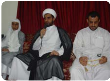
مجلس مكتب حملة السادة

من ضمن فعاليات وأنشطة وبرامج مركز الإحياء في رمضان الماضي كان مشروع الإفطار الجماعي الأول الذي أقيم في يوم الثلاثاء ليلة الأربعاء ١٢ رمضان ١٤٣٠هـ الموافق ١ سبتمبر ٢٠٠٩م، حيث كان الإفطار مميزاً كأول سنة تقيمه الجمعية تحت إشراف مركز الإحياء.