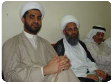
مجلس فتاح خرفوش