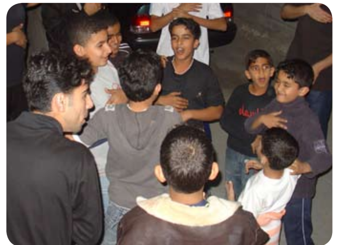
موكب الأشبال محرم ١٤٣٠ هـ

ونحن في جمعية سماهيج الحسينية آيينا على أنفسنا أن نقف مع الأشبال وقفة واعية دعماً لهم ولطموحاتهم وتعزيزاً لمكانتهم في المجتمع وإقامة للشعائر الحسينية الشريفة فكان موكب أشبال سماهيج من أهم أولوياتنا