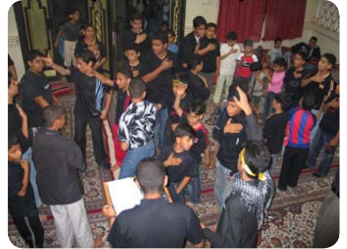
صورة لموكب الأشبال سابقاً عام ٢٠٠٦ م

منذ اليوم الأول من انطلاقة إدارتنا وحتى الآن وهي قائمة من أجل تقوية الشعائر الحسينية والموكب الحسيني بشكل خاص لأن الموكب هو ثقافة للثورة الحسينية الشريفة وهو صوتٌ هادر لشعارات الإمام الحسين (ع) وهو أحد المصاديق العملية للأمر بالمعروف والنهي عن المنكر في حاضرنا هذا المليء بالويلات